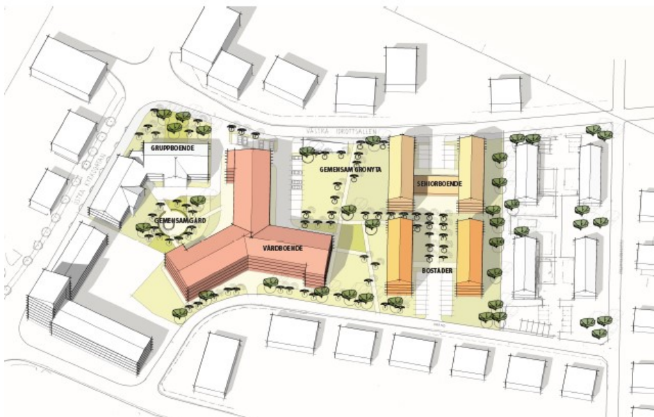
Illustration ur ansökan